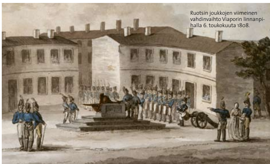
Ruotsin joukkojen viimeinen vahdinvaihto Viaporin linnanpi-halla 6. toukokuuta 1808.

Cronstedt levde med stöd av en pension som den ryske kejsaren hade beviljat ett undandraget liv på Hertönäs gård ända fram till sin död år 1820.